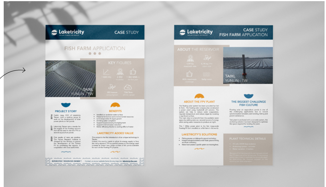
Flyer // Case Study Laketricity