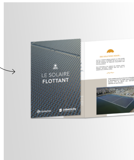
Brochure Commerciale Laketricity