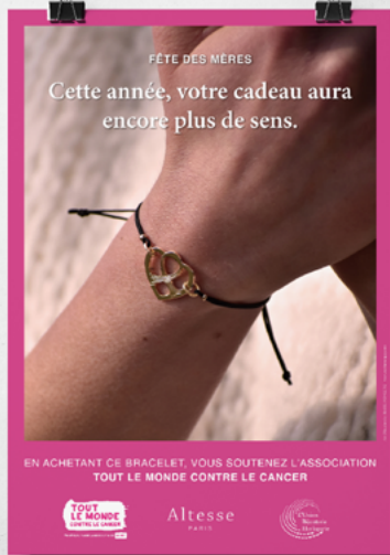
Affiche pour la Campagne Fête des Mères Association Tout le Monde Contre le Cancer