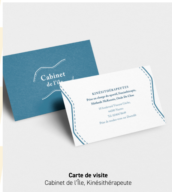
Carte de visite Cabinet de l'Île, Kinésithérapeute