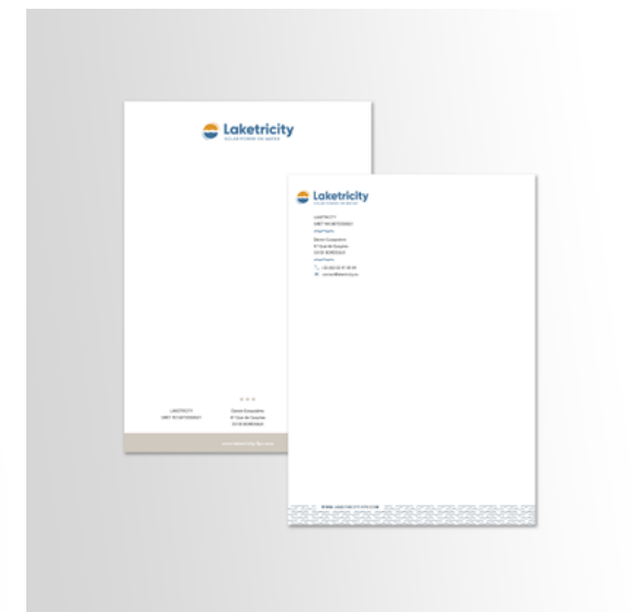
Papier En-tête Laketricity